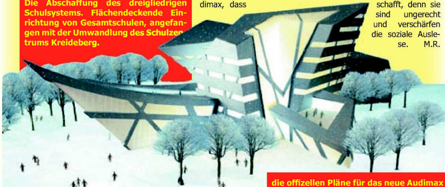
die offiziellen Pläne für das neue Audimax

Die Abschaffung des dreigliedrigen Schulsystems. Flächendeckende Einrichtung von Gesamtschulen, angefangen mit der Umwandlung des Schulzentrums Kreideberg.