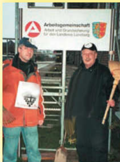
1-Euro-Zwangsarbeiter demonstrieren vor der ARGE

Sie putzen Schulen, fegen die Lüneburger Innenstadt, pflegen die Parks, kellnern im Café, graben Teiche oder helfen in der Ratsbücherei beim Sortieren der Bücher: Das alles für 1 oder 2 Euro in der Stunde. Es sind Hartz-IV-Empfänger, die zu dieser Arbeit gezwungen werden können, denn sonst werden Ihnen die Sozialleistungen gestrichen. 761 1-Euro-Jobber gibt es im Landkreis Lüneburg. Im Gegensatz zu normalen Arbeitnehmern erhalten sie keinen bezahlten Urlaub und keine Lohnfortzahlung bei Krankheit. Von Weihnachts- oder Urlaubsgeld können Sie nur träumen. Mehr auf Seite 3